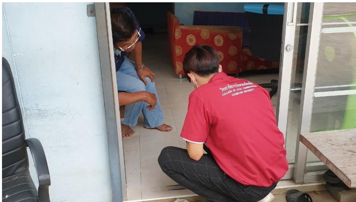
ภาพที่ 5.6 ทีมงานนักวิจัยลงพื้นที่แจกแบบสอบถามในเขตอบต.โจดหนองแก อ.พล (5)