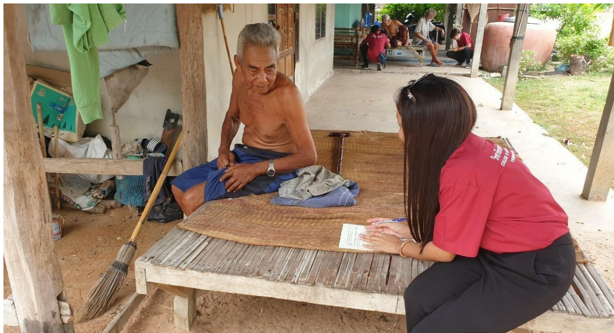
ภาพที่ 5.2 ทีมงานนักวิจัยลงพื้นที่แจกแบบสอบถามในเขตอบต.โคดหนองแก อ.ฟล (2)